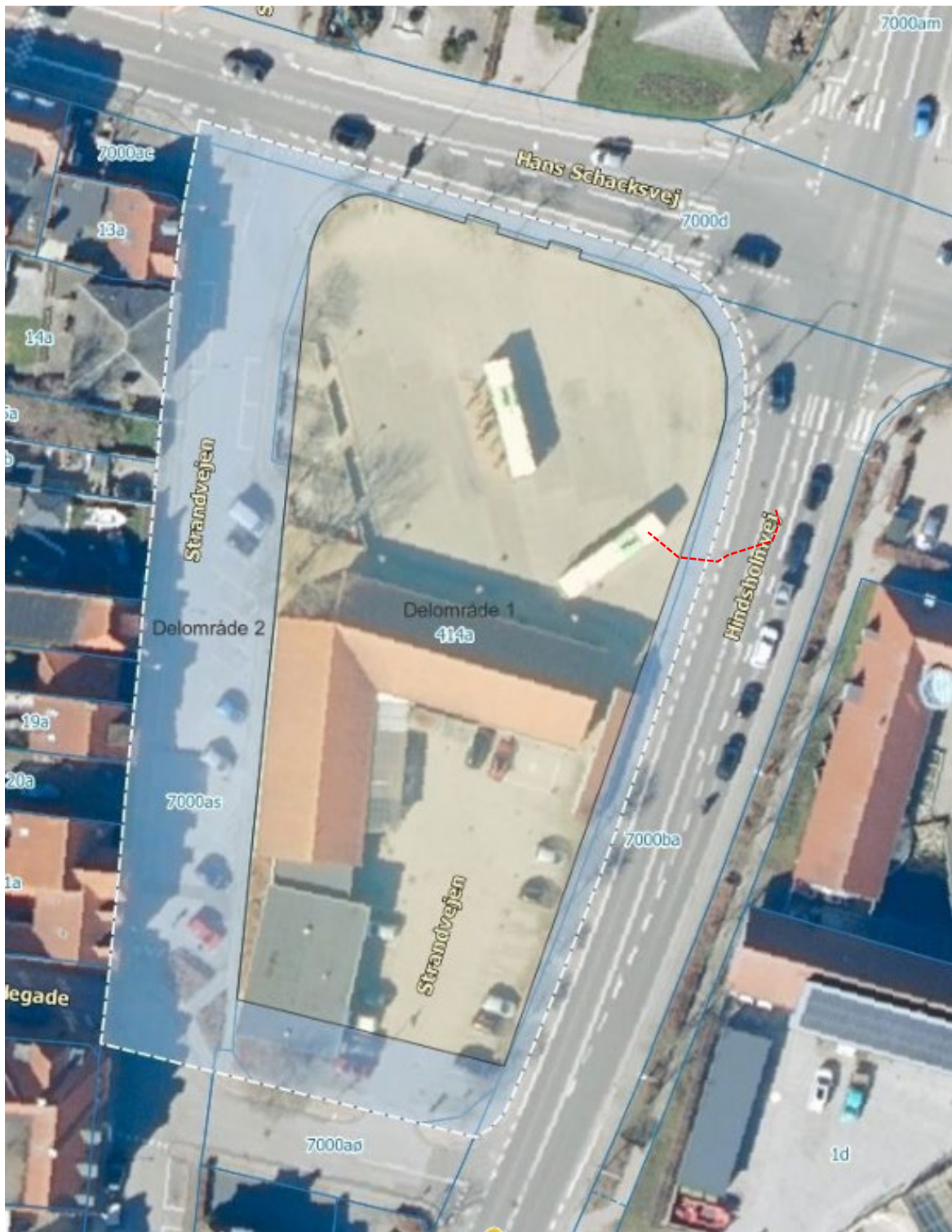
Figur 2: Oversigt over lokalplanområdet med den nuværende anvendelse af området. Dette tillæg dækker kun delområde 1 i lokalplan 349: Byudvikling ved Strandkilen Syd, Kerteminde.