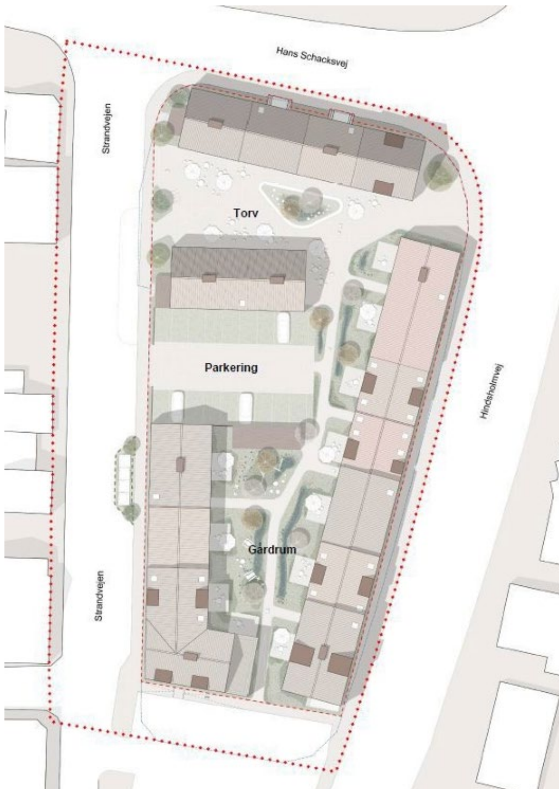
Figur 3. Eksempel på hvordan bebyggelsen evt. kan disponeres omkring torv og et indre gårdrum.